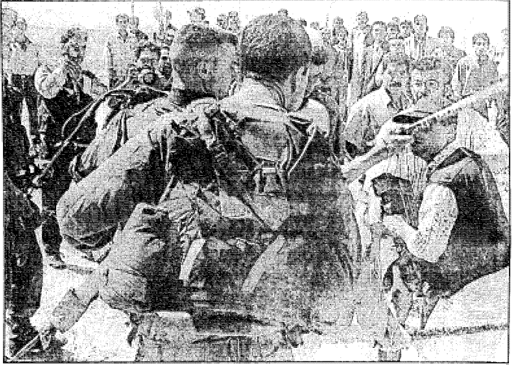
شباب الانتفاضة في مواجهة شيطان الاحتلال